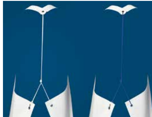
Tragegarnitur in Y-Form mit elastischer Nackentlastung (Blau oder Weiß)