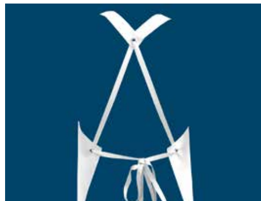
Tragegarnitur in X-Form aus hygienischem Schürzenmaterial