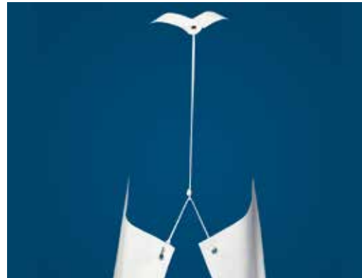
Tragegarnitur in Y-Form mit elastischer Nackentlastung