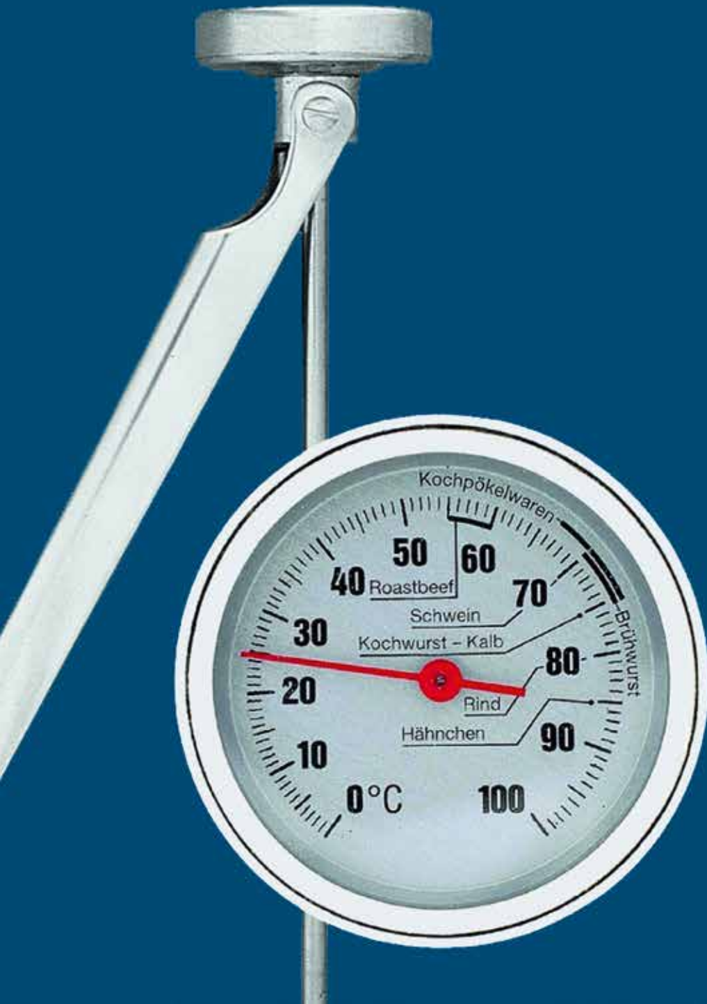
THERMOMETER / DIVERSES